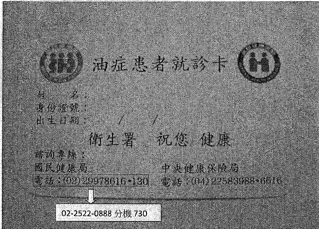
(第 1 代油症就診卡)